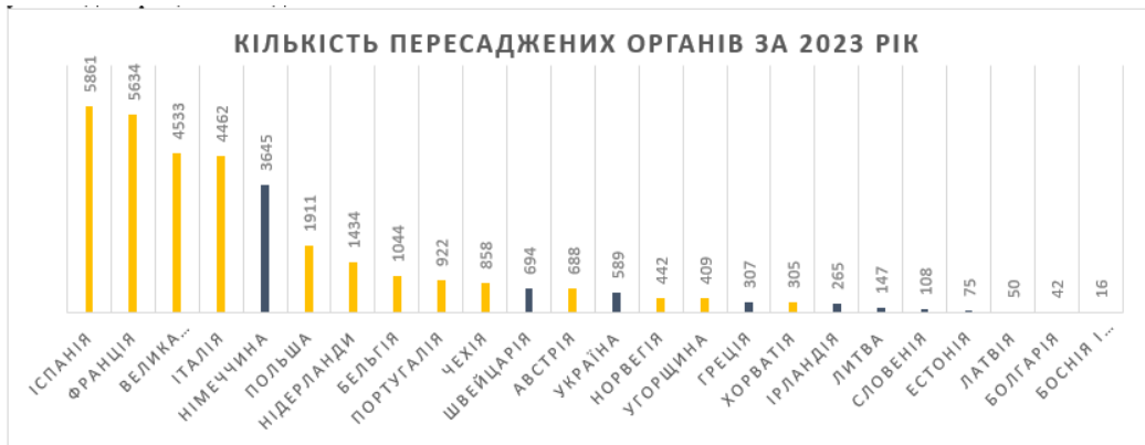
Рис. 2. Кількість пересаджених органів за 2023 рік у країнах Європи

Відповідно до рис. 2 «Кількість пересаджених органів за 2023 рік у країнах Європи» можна зазначити, що країни у яких діє презумпційна згода, пересаджують більше органів за рік, чим країни у яких діє процес незгоди.