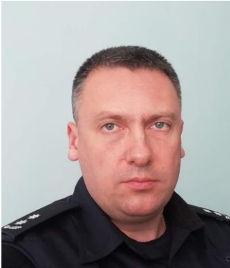
Олександр Валентинович ГЕРАСИМЕНКО (Управління стратегічних розслідувань в м. Києві Департаменту стратегічних розслідувань Національної поліції України, м. Київ)